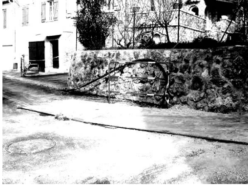
REOUVERTURE DE LA MONTÉE DU SUQUET

Pourquoi ne pas avoir attendu pour refaire les revêtements ?