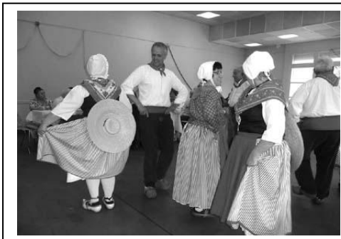
Les danseurs à la Fête des Mais

Que les amateurs du folklore provençal, de quelque région qu'ils arrivent, n'hésitent pas à se manifester, ils sont toujours les bienvenus au sein du groupe.