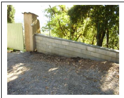
Le mur condamnant ce chemin