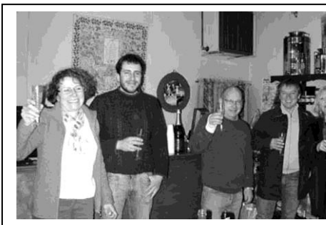
Les médailles fêtées au Moulin Baussy